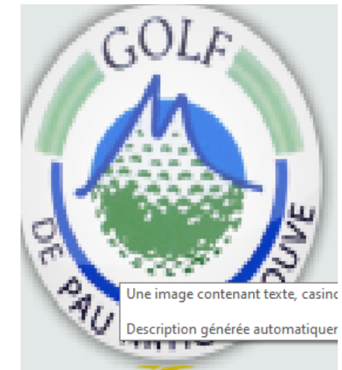
Une image contenant texte, casinc Description générée automatiquer